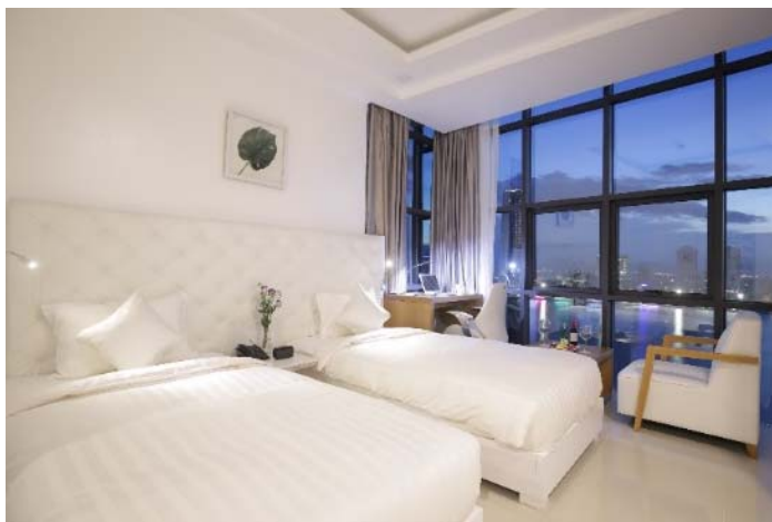
ハン川の夜景を望む客室