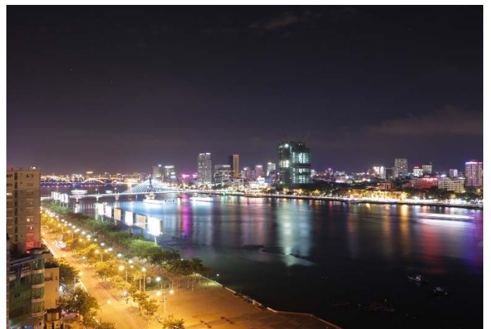
室内からの夜景 (左奥 ドラゴンブリッジ)