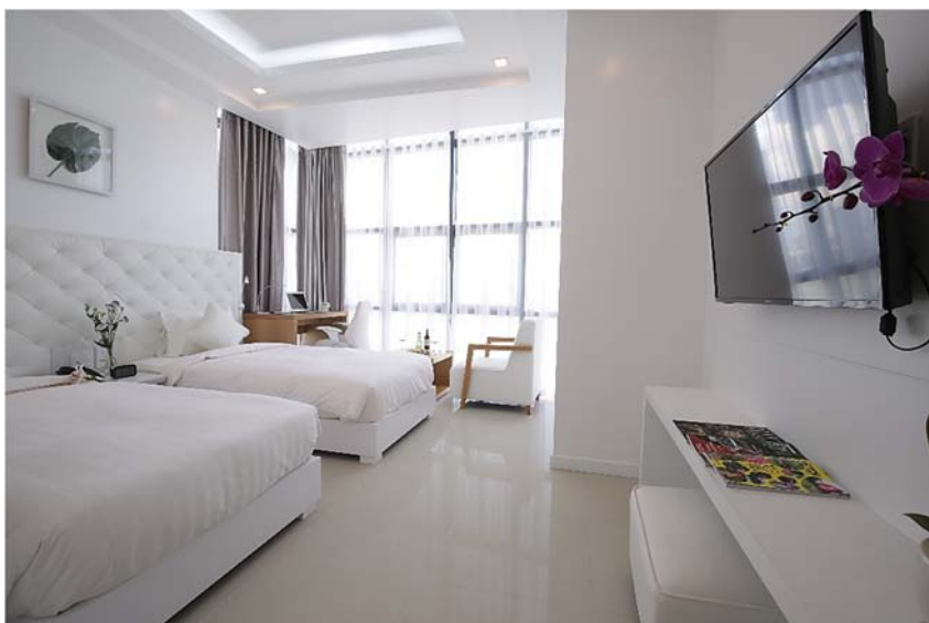
明るく清潔な客室

世界的に注目を集める人気観光都市、ベトナム中部のダナンにおいて、2016年8月に開業した当社の海外第1号ホテル「The Blossom City」は、自社ブランドである「日和ホテルズ&リゾート」のカジュアルブランド「たびのホテル」として新たに生まれ変わりました。都市中心部の立地でカジュアルな旅を満喫できる「TABINO」ブランドホテルの一員として、コンセプトである「心温かいホテル」をより深く追求してまいります。