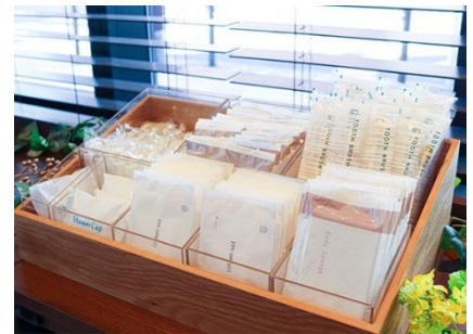
フリーアメニティコーナー