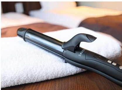
ヘアアイロンも全室常備

また、SDGs（持続可能な開発目標）の取り組みの一環として、プラスチック削減およびリサイクル促進を目的に、フロントに フリーアメニティコーナー を設置しています。綿棒、コットン、ボディタオル、ヘアブラシ、ヘアゴム、カミソリ、ティーバッグなどを取り揃え、必要な分だけお取りいただくことで、環境負荷の軽減に努めています。