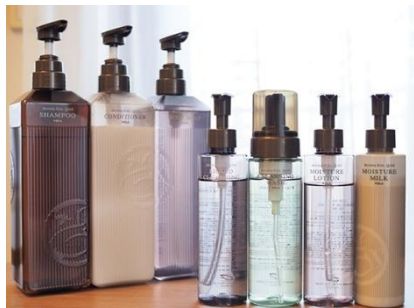
バスアイテムと基礎化粧品