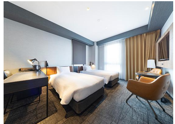
「スイートルーム」※ユニバーサルルーム利用可