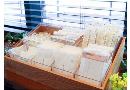
フリーアメニティコーナー