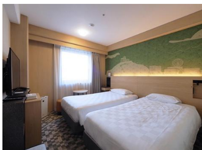
「スタンダードツインルーム」